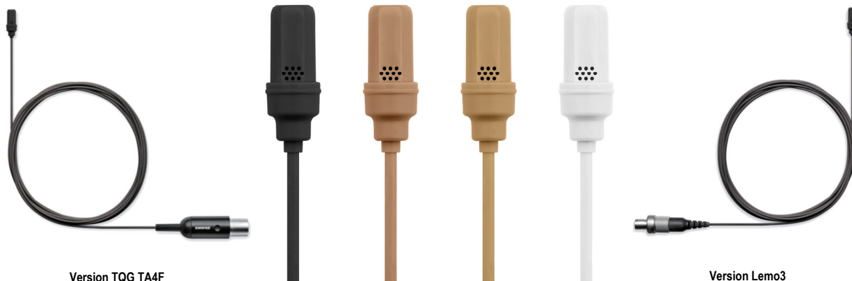
Version TQG TA4F